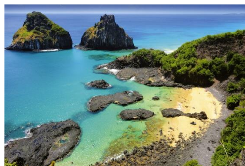
Fernando de Noronha