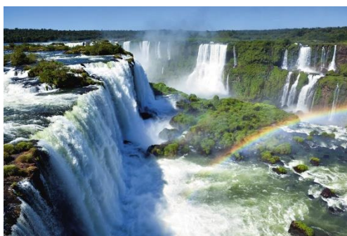
Iguaçu National Park