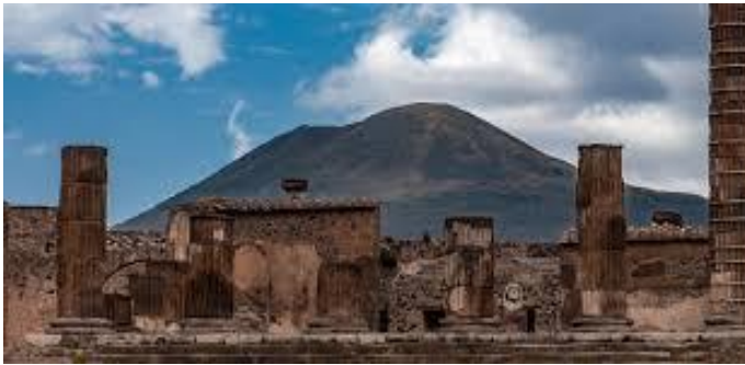
Pompéia com o Vesúvio ao fundo.